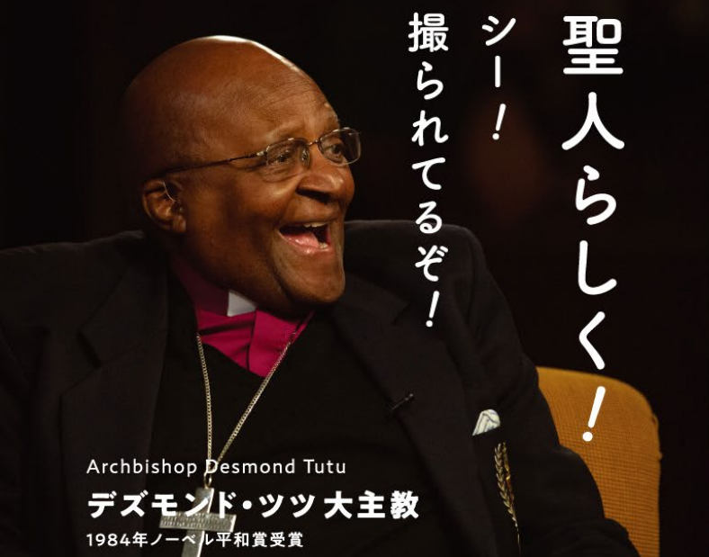
Archbishop Desmond Tutu