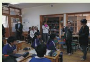
島根県海士町で6年生と地産地消給食の献立を考える

監督・撮影・編集 田中順也 プロデューサー 長谷川ミラ、田中順也、 阿部裕志、小野寺愛 出演 アリス・ウォーターズ 他 制作 jam 製作 海士の風 字幕 小野寺愛 配給 ユナイテッドピープル 66分/日本/2024年/ドキュメンタリー