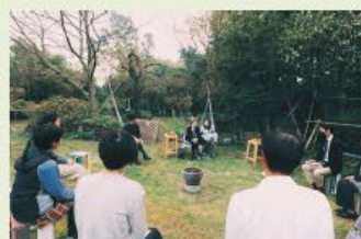
京都府亀岡市で生産者、教育者と語り合う