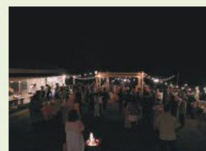
徳島県神山町のファーマーズ会議